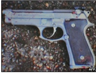
То самое оружие в период учёбы.