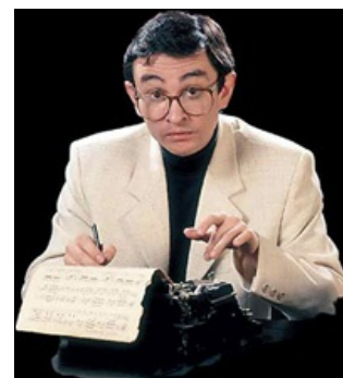
Сочиняет лукаво и как о говне

По большей части акынствует — что не понравилось (или понравилось), о том и поет. Так как бывший медик, то первым в списке нед(р)угов — государство, над которым глумится с особым цинизмом (см., например, «Свободная частица»). Но может пройти и по более мелким целям — угонщикам, последователям Фоменко , даже по авиакомпании, проебавшей его багаж . Отдельно бульдозером прошелся по бардам («Разговор с критиком»). При этом довольно много туристов, и не слишком ФГМнутые КСПшники вполне считают его годным бардом, и с удовольствием поют. У костра и в палатках, да.