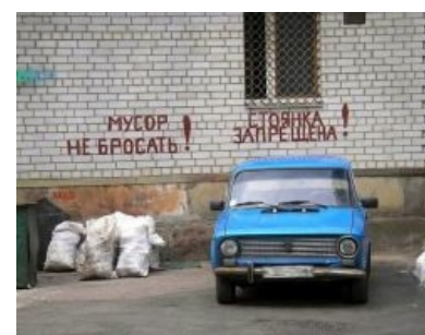
Наглядный пример. Скоро здесь насрут

Но существует определённая прослойка людей, которые будут гадить тогда и только тогда, когда уже и так насрано, но при этом ведут себя культурно, когда вокруг чистота и порядок. В этом и заключается прикол. Если понаблюдать, то можно заметить, что