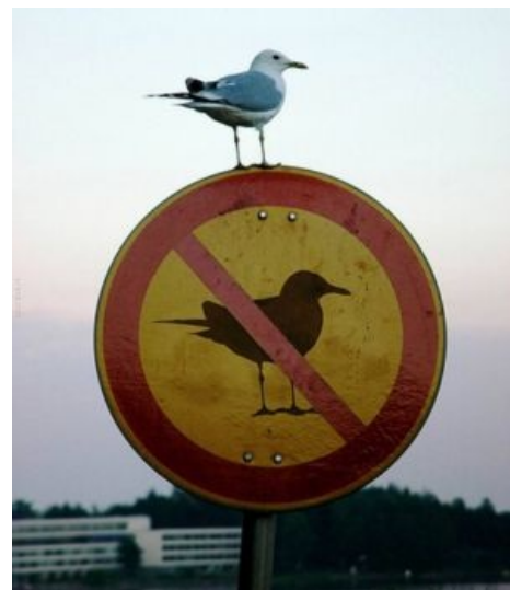
С этого всё и начинается

Как нетрудно догадаться, пункт № 1 является самым трудновыполнимым, № 2 — самым неочевидным, а