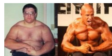
Хочешь так же? Покупай наш массажёр!

Первым продавцом товаров на только-только появившемся телевидении стал американец со смешной фамилией Рон Попейл . Начав путь к успеху как уличный продавец, в начале 50-х годов он снял серию рекламных роликов про Ronco Spray Gun — самый обыкновенный садовый пульверизатор. Затем последовала овощерезка оригинальной конструкции. Купившись на новую замануху, доверчивые зрители смели все насадки для шланга с овощерезками и требовали еще. В итоге Рон и его компания Ronco заработали 2 миллиарда долларов.