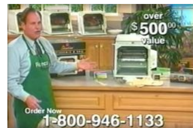
Типичный американский телешоп Ronco

Телемагазин ( магазин на диване, телешоп ) — старший брат интернет-магазина из зомбоящика . Именно он в суровые 90-е рассказывал изголодавшемуся в Совке потребителю обо всех достижениях народного хозяйства капиталистических стран . Ранее был распространён повсеместно, но в связи с удорожанием эфирного времени и появлением более прибыльных этих ваших лохоугадаек перебрался на собственные каналы, где вещает круглосуточно, а также в интернет, где маскируется под телемагазин, часто таковым не являясь .