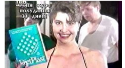
Один из наших магазинов на диване