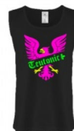
Появился новый танец: тевтоник!