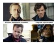
Шерлоки здорового человека, курильщика, алкоголика и наркомана