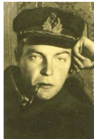
Иван Евремов (да, тот самый), Ленкорань, 1926.

Типичный современный курильщик — не Том Сойер, и уж тем более не Геккельберри Финн! Он даже не