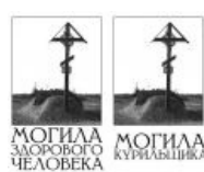
Могила здорового человека — могила курильщика