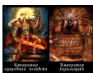
Император здорового человека — император курильщика

Мем пошёл от медицинских фотографий со сравнением лёгких здорового человека и курильщика. Сия пропаганда ЗОЖ так часто мелькала в СМИ, что успела порядком подзаебать юзверей, и они начали фотожабить сравнения нетипичных для курильщика объектов вроде президента курильщика, кота курильщика, курильщика курильщика etc. Предполагается, что X курильщика — плохой, негодный, тогда как X здорового человека совсем даже наоборот. Фишка многим пришлось по нраву и уже давным-давно переросла оригинал, теперь зажабить могут и что-нибудь наркоманско-абсурдное.