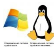
OS курильщика — OS здорового человека