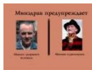
Маньяк здорового человека — маньяк курильщика