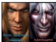
Артас здорового человека — Артас курильщика