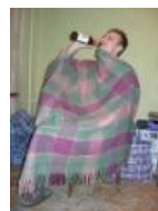
Кубический острый перец в ТКП-материи