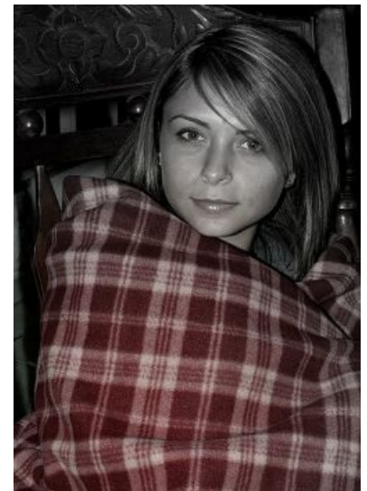
Сферическая тупая пизда в тёплом клетчатом вакууме

На самом деле во всём виноват Щипачёв. Он как-то обратил мое внимание на то, что во многих постингах/высказываниях/диалогах и т. п. у кучи девиц фигурирует Тёплый Клетчатый Плед. Они зачем-то постоянно хотят в него завернуться. С чем это связано — науке до сих пор неизвестно, фрейдистские объяснения, кажется, не подходят, логических, думаю, и не стоит искать. Так вот — после этого щипачевского замечания, мне этот чёртов плед действительно стал постоянно встречаться, а вчера, как вы видели, довел уже почти до истерики. «Что может быть приятнее, чем, завернувшись вечером в тёплый клетчатый плед, курить настоящие gitanes, потягивать матэ, перечитывать Кортасара и чувствовать себя кошкой?»