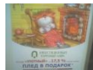
Совмещена тема ТКП и уютенького