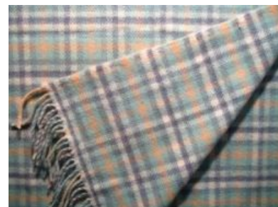
Тёплый клетчатый плед собственной персоной

ТКП — сокр. от «тёплый клетчатый плед». Мем вброшен Тусовкой™ . Проходит по касательной с мемом духовно богатые девы , принятым в ГО, но отличается от него именно «male chauvinist pig» контекстом.