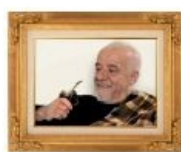
ТКП, мате, Коэльо