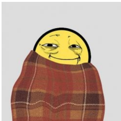
Влюблённая шотландская картошечка