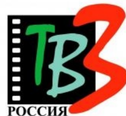
Самый первый логотип

В 2011 году учёные Государственного астрономического института имени Штернберга ( ГАИИШ ) опубликовали заявление, в котором призывали учёных не давать интервью каналам ТВ-3 и РЕН ТВ :