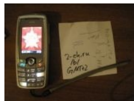
Это тоже «Семён»