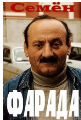
Пример картинка с Фарадой

— Стивен Хокинг Кратчайшая история времени