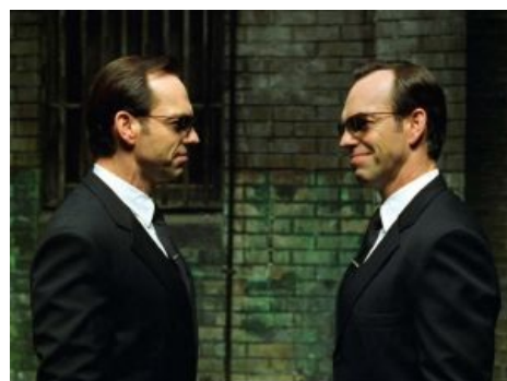
Агент Смит знает толк