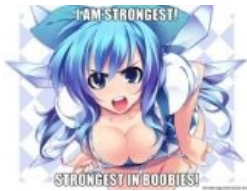
Сырно с сиськами