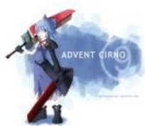
Advent Cirno с арбузным Чиби Эдвент мечом