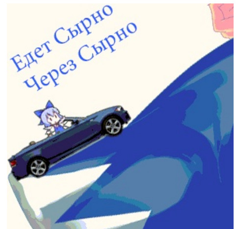
Ехал Сырно через Сырно