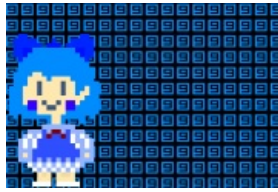
8 9 бит Сырно