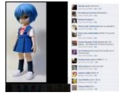
Newfag, newfag never changes