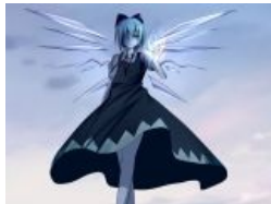
Такая разная Сырно