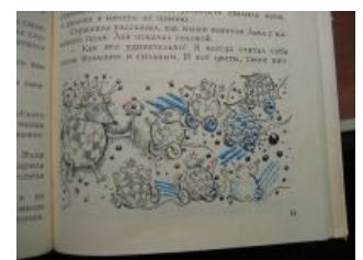
Мыши сферические в вакууме