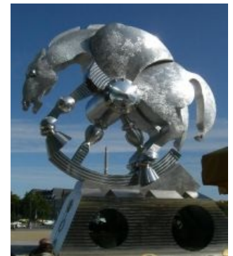
Памятник сферическому коню в Берлине