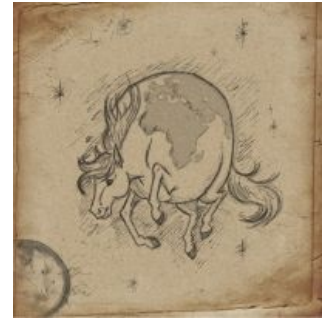
Сферический конь в космосе

Исходя из вышесказанного, мы имеем дело с частным случаем черной дыры , которая, как известно, не имеет волос, сферична и содержит в недрах сингулярность. Следовательно, сферический конь не гадит (но может со временем начать испаряться, завершая этот акт невъебленным взрывом), может сливаться с другими конями и держать вокруг себя Галактику. Есть мнение, что одним из итогов запуска БАК станет создание планковских сферических коней.