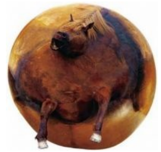
Сферический конь 3D