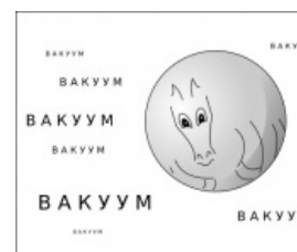
Сферический конь в вакууме