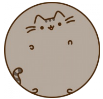
Сферический Пушин в вакууме