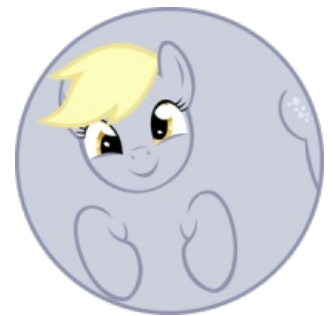
Сферическая пони в вакууме

Марья Ивановна спрашивает Вовочку на уроке физики.