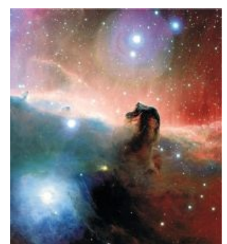
Сферический конь в