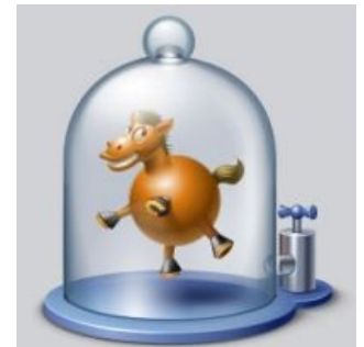
Конь сферический 2.0, от МОВІТЕСН