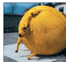
IRL в воздухе