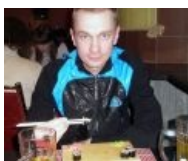
Белорусский подозреваемый в теракте в минском метро ебошит суси под истинно иппонскую «Аліварью» — светлое в «Абибасе»!