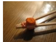
Палочки для нубов