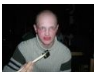
Типичный потребитель СуШик с признаками поражения центральной нервной системы