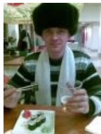
Новобайдаевский знаток и ценитель суши