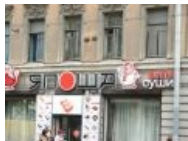
Типичный гельминтарий [4]