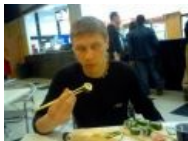
Завсегда в райцентре Луганской губернии