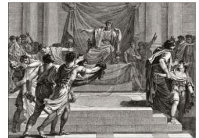
Проскрипции в Риме. Головы убитых подносили сидевшему на форуме Сулле.