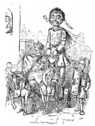
Митридат VI Евпатор, карикатура Джона Лича

Подходившие к проскрипционным спискам обвинялись