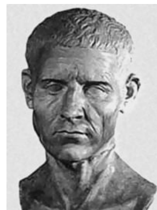
Ягами Лайт Древнего Рима

Луций Корнелий Сулла Счастливый (лат. Lucius Cornelius Sulla Felix , 138 — 78 до н. э.) — расовый римский полководец и государственный деятель, эталон диктатора и изобретатель расстрельных списков . Своей деятельностью предопределил последующее превращение Республики в Империю. Позднее Суллу с успехом копселили Гитлер , Пиночет и другие официальные лица .