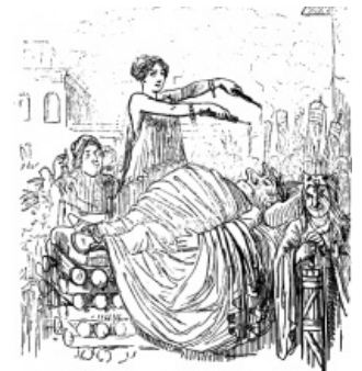
Похороны Суллы, карикатура Джона Лича

Все это питало болезнь Суллы, которая долгое время не давала о себе знать, — он вначале и не подозревал, что внутренности его поражены язвами. От этого вся его плоть сгнила, превратившись во вшей, и хотя их обирали день и ночь (чем были заняты многие прислужники), все-таки удалить удавалось лишь ничтожную часть вновь появлявшихся. Вся одежда Суллы, ванна, в которой он купался, вода, которой он умывал руки, вся его еда оказывались запакошены этой пагубой, этим неиссякаемым потоком — вот до чего дошло. По многу раз на дню погружался он в воду, обмывая и очищая свое тело. Но ничто не помогало. Справиться с перерождением из-за быстроты его было невозможно, и тьма насекомых делала тщетными все средства и старания.