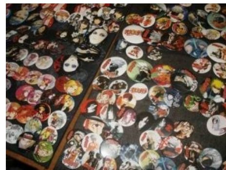
Значковый рай аниме-любителя

Если на этой картинке вы увидели только голую, татуированную бабушку-байкершу, то вам пора выключить компьютер и пойти прогуляться