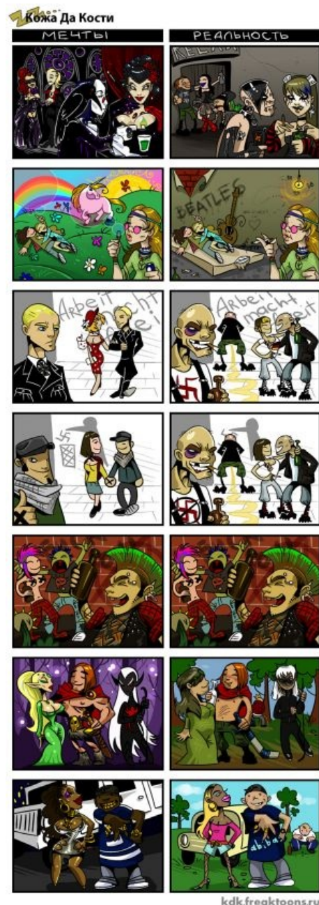
Мечты и реальность