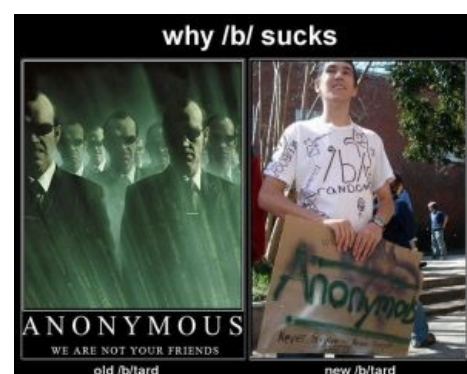
Мечты и реальность ностальгирующего Анонимуса

«Любовь к себе подобным и неприязнь к непохожим на себя рождена желанием выделиться из толпы. Но разве тот, кто жаждет выделиться из толпы, и в самом деле человек выдающийся? »