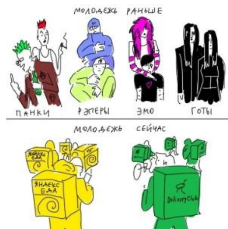
Состояние дел сегодня

Наиболее ярким примером сабжа являются «молодёжные субкультуры», в просторечии — «неформалы». Их главная фишка в