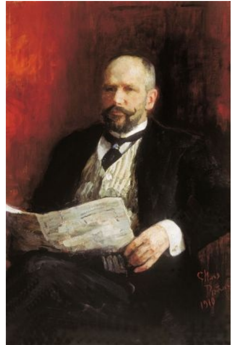
Портрет Петра Столыпина кисти Репина