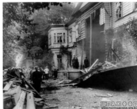
То, что осталось от дома

С либерастами Столыпина от самого начала его карьеры связывали отношения заклятых врагов . Соль в том, что ещё в бытность его губернатором Засратова, как местная, так и питерская либерастня всячески тормозили его предложения царю. Стоило Столыпину попасть в число думских законодателей, он тут же