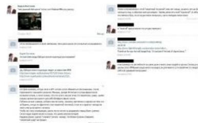
Даже прuffy не работают