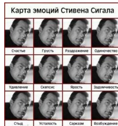
Карта эмоций Стивена Сигала