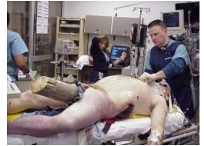
Стержень в природе

Стержень — виртуальный орган, служащий источником неестественного характера и силы человека. Иногда ассоциируется с позвоночником , но чаще — с Мужским Половым Хуем , причём не только с собственным, но и вставленным извне, так чтоб голова не качалась. В реальности, как и отмечено — виртуален, ага.