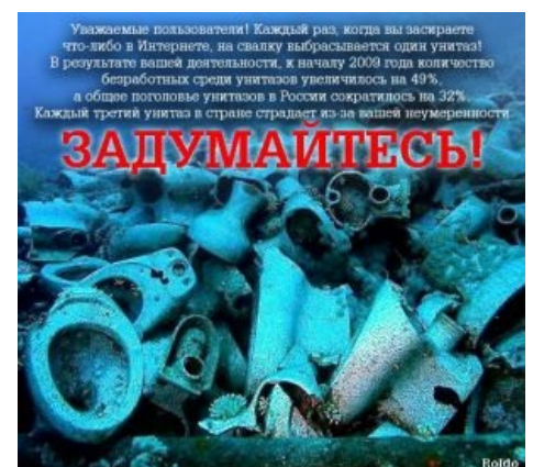
Последствия срачей в интернетах