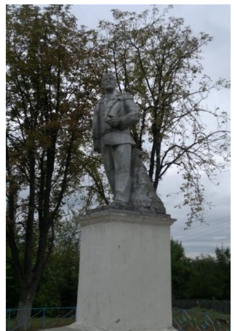
И даже Войте