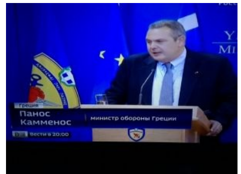
Просочилось в политику

Фраза «Когда ты увидишь это, ты вырешь кирпичи» является классической, устоявшейся и неизменной в так называемом майндфаке, разновидности демотивационного постера . В данном контексте означает скорее удивление, чем испуг, но несмотря на это как нельзя лучше отражает суть майндфака.