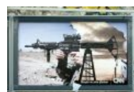
Юзер-мануал от CNN