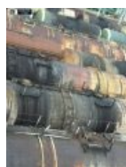
Сотни нефти стоят на станции и ждут, пока их награбит Анонимус