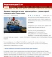
Тысячи тонн для Палестины доставляют корреспонденты