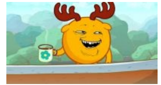
Лосяш какбэ намекаэ