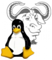
Тукс и Аццкая Сотона