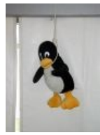
Шкаф BSDшника . Сородичи Тукса.