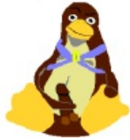
Тукс в образе Чёрного Властелина