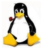
Тукс лениво курит (эмблема Слакваря).