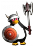
Тукс — финский викинг. Красноглаз и безбород.