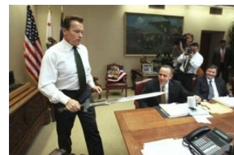
Губернатор Шварценеггер готовится к войне за независимость НКР

После переизбрания негативного президента история внезапно получила продолжение, население некоторых штатов собирает подписи за выход из состава США и в некоторых случаях даже успешно, Батрак Абрамгча тоже не льком шит, у него уже всё готово к массовым расстрелам и отдыху особо несогласных в специальных курортах за ключей проволокой, картинки со здоровыми пластиковыми контейнерами-гробами и санитарными