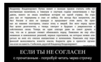
Люби Путина, сука! Читай всё подряд!