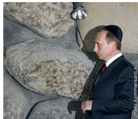
Путин в кипе

У-гу... Я понял недавно, Что вряд ли грозит мне импичмент. У-гу... Какой же я славный И как я себе симпатичен!