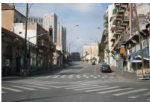
Бурление шабатней жизни в иерусалиме.

Ну и вершина всей еврейской мысли — шабесгой , специальный доверенный работник не-иудей, который по субботам будет делать всё, что надо, ему-то Б-г ничего не запрещал. Тут, правда, тоже не всё так просто. Шабесгой нельзя просить прямым текстом, только наводить на мысль осторожными намеками, ни в коем разе не называя действия, которое надо совершить или предмета, с которым придется взаимодействовать. К анонимусу как-то пришли за помощью бедолаги, которые забыли выключить кондиционер настроенный на сильное охлаждение и начали планомерно вымерзать. Шли пешком несколько километров, как бы невзначай прошли мимо и стали рассказывать как у них дома холодно, дует и не хочет ли он составить компанию и прогуляться до их дома и посмотреть. К их восторгу, анон тупил минут пять, пока сообразил (если б сразу понял, то вышло бы не совсем кошерно), а потом таки пошел и вырубил прибор КЕМ.