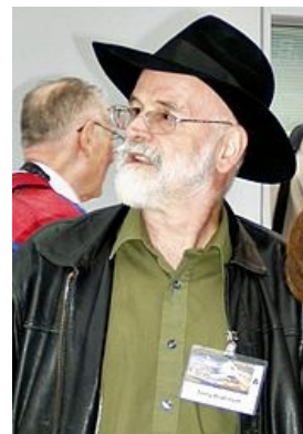
Терри смотрит на Смерть, как на мистера