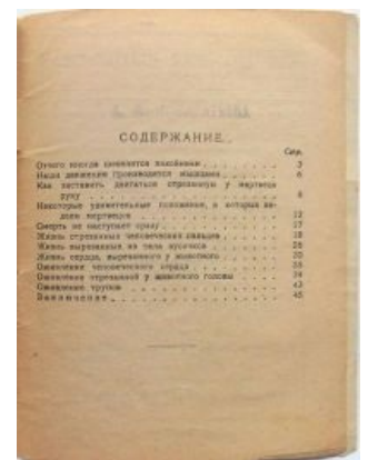
Пособие начинающим Франкенштейнам

А ещё ранее один итальяшка решил провести разряд тока через свежееубитую лягушку, которая ВНЕЗАПНО начала конвульсивно подёргиваться. ЧСХ, этот макаронник по имени Луиджи Гальвани подумал, что это могут быть и признаки избавления от железной хватки смерти и, возможно, мозг генерирует электричество для управления мышцами. Гальвани стал основоположником животного электричества. А вот его племяшка Альдини понял, что нужно срочно искать лысую обезьяну для проведения такого значимого эксперимента. Обезьяна была найдена в лице одного казнённого поциента, а результаты оказались всё теми же: лишь тушка задёргалась и гримаса покорчилась, застыв в ещё более ужасном положении. Фейл . Но! Насилование трупов электрическим током стало предпосылкой к появлению одной обожаемой реанимационными бригадами и их поциентами вундервафли — дефибриллятора.