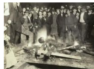
Улыбаемся и машем,