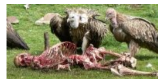
Смерть — это вкусно!

Как способ наказания/времяпрепровождения