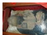
Целиком весь святой