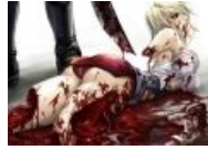
Вроде, дышит ещё, но это ненадолго