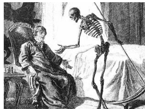
Please stand up