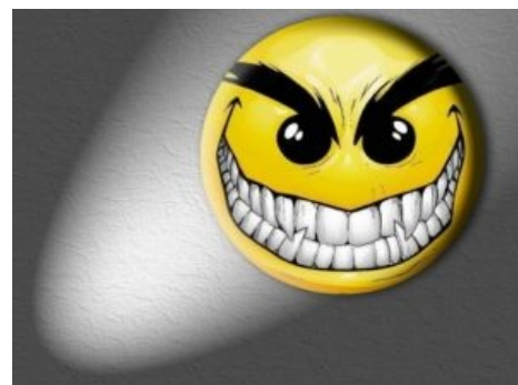
ДА, это он самый. Узнали?

Стоит заметить, что использовать смайлы по своему первоначальному предназначению — для выражения эмоций — никто не запрещает, но помните: все хорошо в меру.