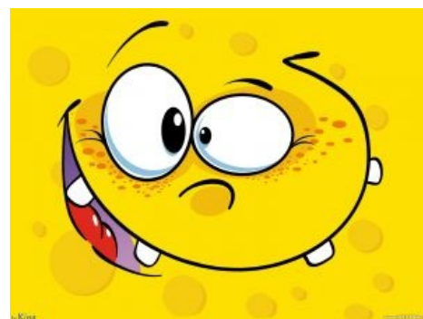
Классический вид анфас типичного смайлофага.

Такие проявления могут наблюдаться при достаточно широком спектре пограничных психических состояниях. Чтобы выяснить точно Ваше состояние и назначить адекватное лечение, необходимо предварительно провести очное обследование. Обратиться нужно к врачу психиатру-психотерапевту.