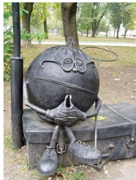
Памятник Колобку в Донецком парке кованых фигур.