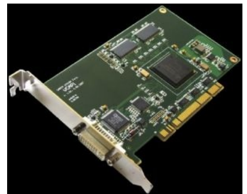
Карта DVI/VGA видеозахвата — Unlimited screenshot works!

Также BSOD'ы хранятся в директории %WINDIR%\minidump (файлы .dmp ). Содержимое можно просмотреть, например , с помощью утилиты BlueScreenView .