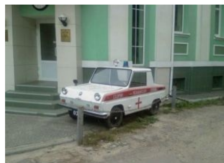
Для гражданского населения