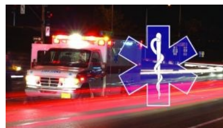
Пафос включён в стандартный набор