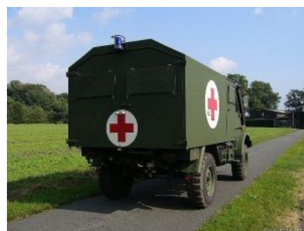
В стиле «Милитари»

https://www.youtube.com/v=5aomFAkDwPI И дополнительно по теме реанимобилей