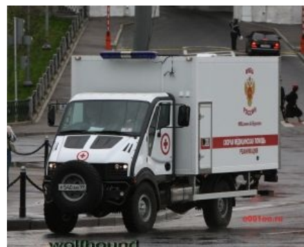
Вот такая кремлёвская реанимация