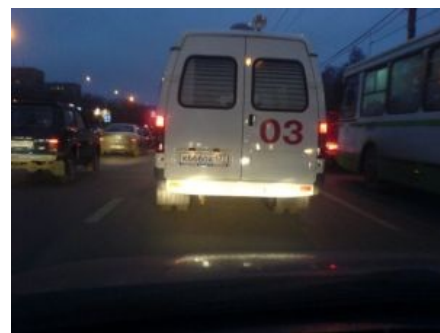
Везем в правильное место

«Скорая медицинская помощь» — структура, финансируемая из бюджета, и должна оказывать услуги безвозмездно, а вознаграждение эскулапов остается на совести пациентов. После развала СССР и появления в этой стране богатых людей, у которых денег так много, что они им даже мешают спокойно жить, появилось множество способов помочь избавиться этим товарищам от мешающих им денежных масс. Один из этих способов — это платная скорая помощь, которая предлагает абсолютно такие же услуги, что и государственная (а зачастую и меньше, чем государственная), но за ваши деньги. Работают на платной скорой в основном люди, перешедшие из муниципальной скорой в частную структуру в поисках большого бабла; и совместители, которые работают и там, и тут. Вызвав муниципальных вчера, а платников сегодня — вы рискуете нарваться на одних и тех же людей.