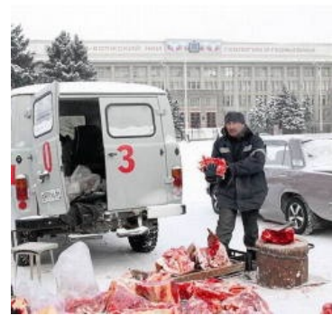
Это только для фото