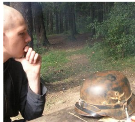
Скин, снятый Хейдиз, в раздумьях Бить Или Не Бить?

В интернете кучкуются на антифа.фм или других подобных, где создают форумы, с призывами выходить на улицы клеить танчики листовки, рисовать граффити и прочие политические акции . В крупных городах есть местные форумы, где они постят фотки фашиков с района. Там же идет обкидывание говном данных персонажей, высвечиваются адреса, телефоны и пр., чтоб если что, можно было раздать пиздюлей. В общем, в сети ведут более широкую пропагандивную деятельность.