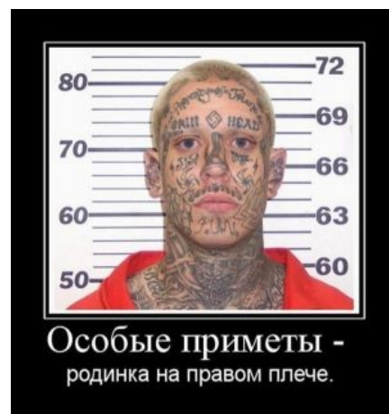
Ясно и так