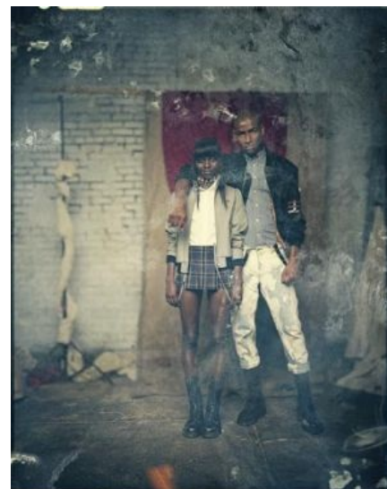
Да, град-скины есть даже в Нигерии!

SHARP (Skinheads Against Racial Prejudices, SHARP , шарпы) появились в Пиндостане в 1987 году после того, как бонов стало чуть больше, чем дохуя . Логотип — перевернутая эмблема музыкального лейбла Trojan records, что как бы намекает. Оно-то да, все дела, против расизма, против предрассудков, но на самом деле сферический SHARP в вакууме нихуя не делает, а ждет, попивая пивко, пока к нему доедутся. Ну или к кому-нибудь. Тогда можно