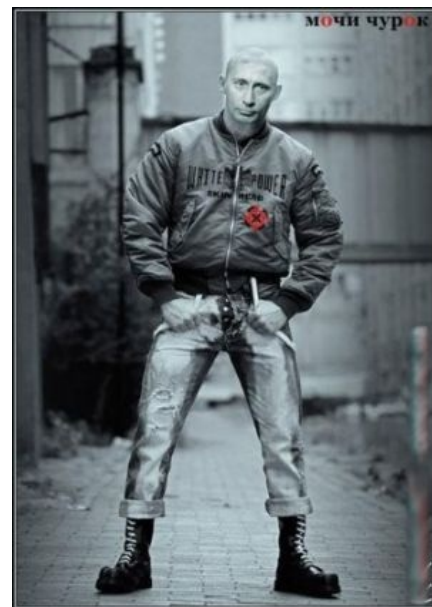
White Power! Мочи чурок!

Кинцо, наглядно показывающее скинов в Пиндостане. Повествует о том, как уличный скинхед, заставивший принять ислам двух цветных, меняет своё мировоззрение, будучи выебанным на зоне в жопу своими же братьями по цвету кожи. Ебля в душевой, нигра с двумя докторскими степенями, вербующий арийцев своими тупыми вопросами, и немножко прона присутствуют. Тут нужно уточнить, что тюремные ёбари были хоть и арийскими пиздобратьями, но покупали у латиносов дурь и продавали белым. А праведный главгерой не понял, что «бизнес-ебизнес», и начал возбужать, за что и понёс суровую кару. Веселья прибавляет то, что в конце фильма ( спойлер : его брата убивает... расовый нигра в школе, лол). Кстати, в рейтинге фильмов всех времён и народов данное творение находится примерно на 30-м месте , а исполнитель главной роли Эдвард Нортон номинировался на премию «Оскар». Алсо, данная кина известна любителям гуро знаменитой сценой «те скены, которые ложат