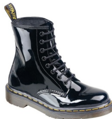
Сферический Dr.Martens в вакууме

Как только количество скинов перевалило за 9000 , всякая политота с баблом и мандатскими портфелями решила, что такую большую ЦА нужно чем-то конкретно окучивать и привнести в скинхед-культуру большой пиздец. Особенно этим отличился подтреотический Национальный Фронт. К тому времени ска, рокстеди и прочая меломанщина всем остопиздела , пипл требовал панк . Панк к тому времени уже был, и уже тогда был уныл , поэтому был запилен свой панк е-блэджжееком и шлюхами ака Oi! . Песни пели не про то, как на улице пиздато , а про то, какое вокруг говно, зато в субботу можно бухать, валяться и домой не появляться. Но затем пришли Skrewdriver , которые начали писать песни патриотического содержания и сотрудничать с правыми политиками. Пипл схавал, начал зиговать и валить не просто так, а исключительно потому, как понаехали .