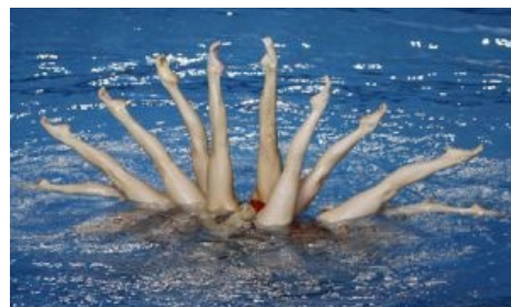
Синхронность 80 уровня

Разумеется, месячные синхронизируются не за месяц или два. Циклы у особей в женском коллективе постепенно начинают перемещаться в сторону самых общительных и наиболее доминирующих в коллективе самок. Таким образом, «альфа-самки» незримо заставляют подстраиваться под свой цикл остальных, ничего не подозревающих, подружек. И конечно, синхронизация совершенно не обязательно начинается сразу у всего женского коллектива, а происходит именно у тех, кто контактирует друг другом с необходимой частотой — так, в случае спортивных команд синхронизация очень сильно выражена, а для тех же женских общаг более вероятны покомнатные/погрупповые/поэтажные синхронизации.