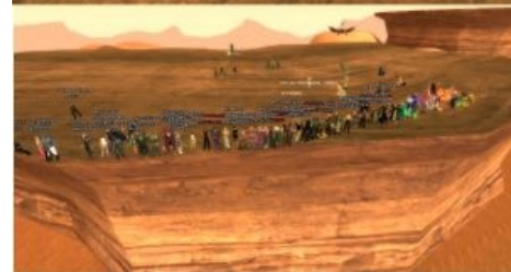
Стоп флуд в мир-чате!!! У нас лучница в «Хромой лошади» сгорела!!!