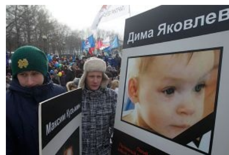
А у вас наших детей убивают!

Человеку свойственно принимать близко к сердцу лишь то, что имеет отношение к нему самому. Ещё у Кастанеды сказано, что жалость к окружающим есть проявление жалости к себе. И нравственность тут не при делах. То есть, подоплёкой этого вашего сострадания в 95% случаев являются такие мыслишки как: «А ведь и