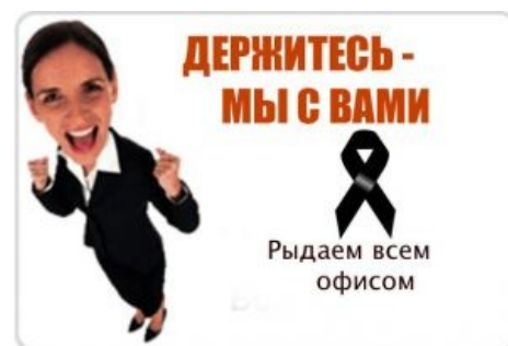
Рыдали всем офисом

Синдрому более всего подвержены, как правило, люди общественные: блоггеры, пользователи социальных сетей, политики, люди искусства и прочие личности «на виду». В ЖЖшке, Вконтакте и, особенно, в Бидлокласниках можно заметить даже одну из дисциплин Специальной Олимпиады — мерянье скорбью, выражающееся в запосчивании как можно большего числа слезливых постов и картинок с последующим выяснением, кто же скорбит трушнее. В равной степени это и офисный планктон, и гламурные кисы, и тупые пезды, которые, без шуток, способны по настоящему огорчиться, жаль только, лишь на краткий период. В меньшей степени синдрому подвержены технари, интеллектуальные меньшинства, рокеры с митолоиздами (если только не убили кого-то из их кумиров, хотя в таком случае скорбь бывает и неподдельной), падонки, наркоманы и т. д.