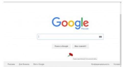
Две лаконичные гвоздички у подножия Гугла . Скромненько так