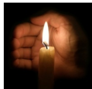
Рука и свеча — минимальная экипировка скорбящего

Нуждающимся передают собранное в соц. сетях