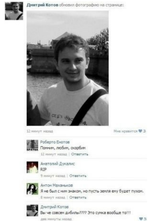
Не без фейлов

На самом деле, такой похуизм — это вин человеческой психики. Вспомните, как умерла ваша бабушка/дедушка/дальний родственник/собака/кот и как по этому поводу вы горевали. А теперь представьте себе, что аналогичные эмоции вы испытываете при каждом ( sic! ) известии о смерти человеческого существа на Земле. Недалеко до реальной Кашенки , не так ли? Даже если ваш разум и способен на такое, то времени на что-либо кроме вставки свечей в блог или на стену Контakta не останется даже на ЖРАТ! Здоровый похуизм — следствие не менее здорового инстинкта самосохранения и продолжения рода. Если бы все люди скорбели по поводу всех трагических смертей в мире, то человечество бы уже давно загнулось в бесконечной и безысходной депрессии .