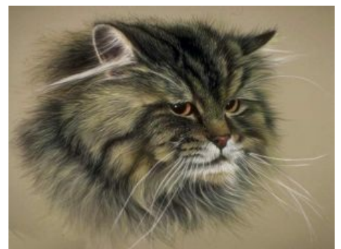
Сибирский кот — няшный маскот Сибири