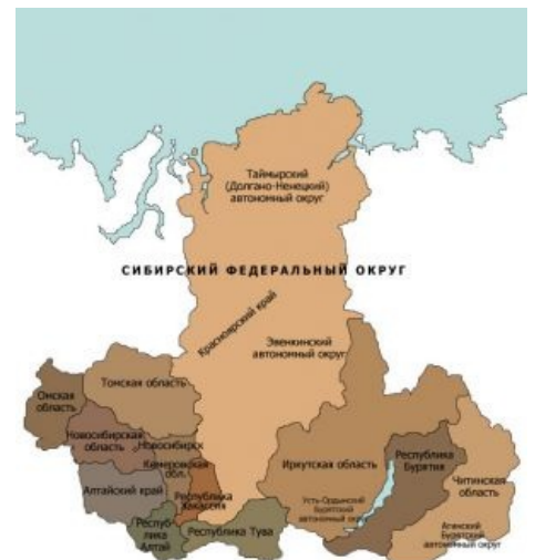
Сибирь хуическая в вакууме

Часто высказываются мысли о том, что пора бы прекратить кормить Москву и замутить в Сибири как минимум автономию. Разумеется, вся реакция москвичей на это сводится к « лол », но в перспективе даже