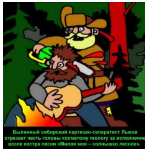
Былинный сибирский партизан-сепаратист Лыков отрезает часть головы косматому геологу за исполнение возле костра песни «Милая моя – солнышко лесное».