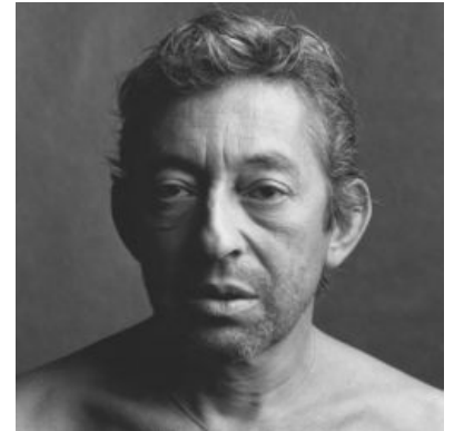
Monsieur Gainsbourg во всей красе

Несмотря на оригинальную внешность, пользовался несомненным успехом у женского пола: это как раз тот случай, когда харизма перевешивает все генетические асексуальные маркеры типа оттопыренных ушей. Харизма же начинала проявляться с первых моментов знакомства. Вспоминает Джейн Биркин, наиболее долговременная его пассия: