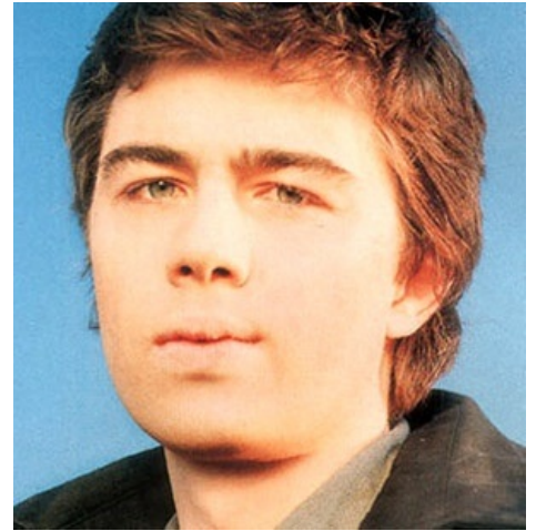
Здесь он ещё тёплый

«Сергей Бодров мл. («Брат», «Брат-2», «Сестры») приступил к съемкам нового фильма с рабочим названием «Мать их». »