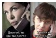
У меня завал