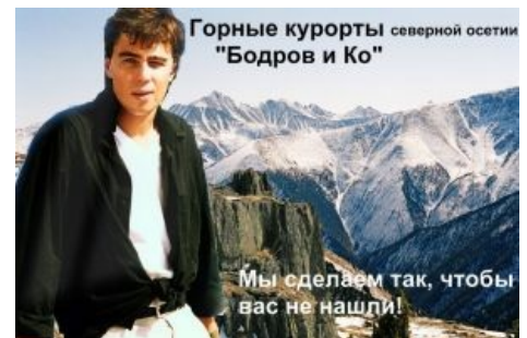
Бодров и Ко

Вариантов может быть много, а гипотез и догадок — ещё больше. Но факт остаётся фактом: никакой точной информации (кроме того, что все попали в ледник) о том происшествии нет. И Бодрова тоже нет.