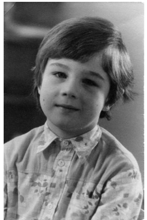
Сила в правде.

— Последняя фраза может варьироваться: вместо «Северного полюса» можно говорить Канарские