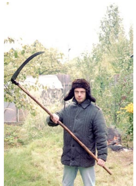
В образе Мрачного Жнеца

— Лукьяненко, «Осенние визиты», 1996 год