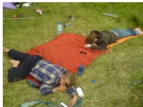
Стандартная поза поклонников этнической музыки

Съемные квартиры , которые хитрые шушенцы без палева предлагают снять у них на время проведения фестиваля. Цены на квартиры колеблются от 500 за день.