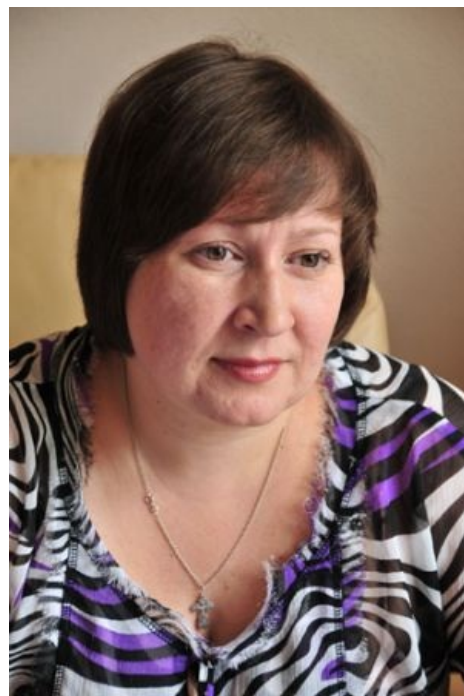
Главорг смотрит на свое детище как на источник профита.

Дикий палаточный лагерь, или прорваться в платный, как русские в Боснию, не платя ни копейки — хотя за машину таки пгидется выложить бабосов в размере 100р. Есть два идеальных варианта: 1) пробраться