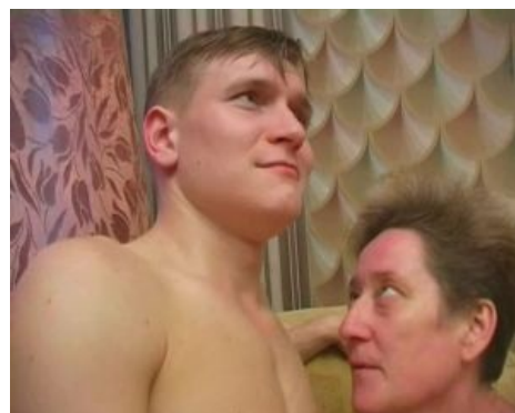
Саша Ювелир aka Николай Ставрогин