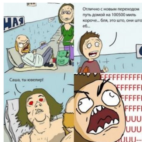
Fuuuuu на тему сабжа

Стоит отметить, что рэп-ансамбль ILWT (In Luck We Trust) сочинил доставляющую песню про сабж (« Взлет и падение Саша-ювелира »), а еще в сети начали появляться пародии на мем. Алсо, мем также был обыгран в пятой серии быдлосериала « Зайцев +1 », 7-м выпуске первого сезона говношоу «ХБ» и в одном из выпусков «Comedy Woman» на ТНТ .