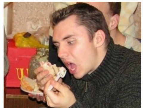
Хомячок показывает своё истинное обличье

Несмотря на весь свой пафос и декларируемый аскетизм, на самом деле большинство мунитов остаются обычными хомячками, в свободное от молитв время во всю практикующими потреблядство . Если начальство не будет следить, хомячки с радостью кладут хуй на строгий режим дня, ритуалы и прочее мозгоёбство. Анонимусу также известны случаи воровства общей кассы, а так же лютый, бешеный фап на прон в интернетах, который обошёлся в 8 килорублей, поэтому и был раскрыт.