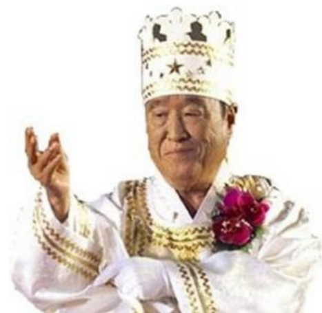
Кагбе говорит нам...

«Во владении сатаны не должно остаться никакой собственности»