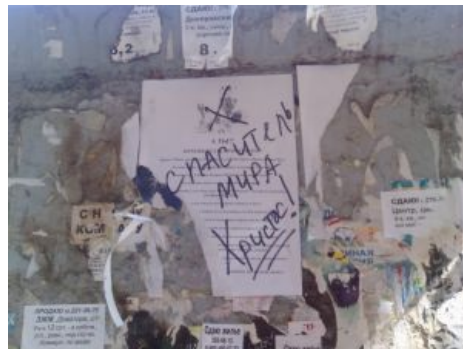
Попаболь христовых поциентов