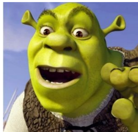
Духовная сущность Мессии. Голодная!