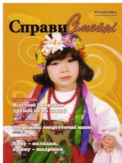
Украина — корейцам!