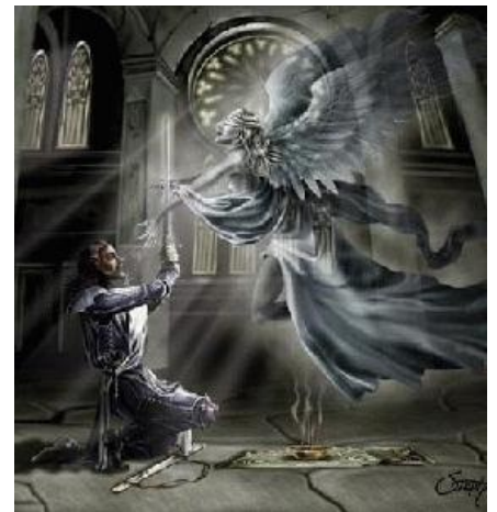
Такими они себя видят