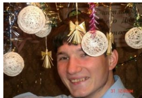
Типичный участник конкурса [6]