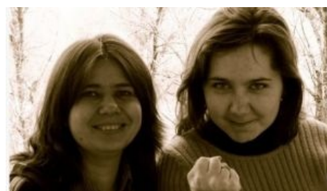
Сектанты не одобряют эту статью

Но самую мякотку для тролля представляет конкурс «Мисс и Мистер Университет». Если ты — студентота, то лулзов можешь получить просто в эпических масштабах! Записывайся на участие в конкурсе, но ни в коем случае не дай хомячкам понять что ты знаешь о секте. Для участия в конкурсе лучше бы тебе уметь играть на гитарке, петь ртом, стоять на голове или что-то подобное. Однако даже если ничего этого ты не умеешь — не расстраивайся, просто создай видимость жгучего желания, ведь твоя цель не победить в конкурсе, а всего лишь добраться до микрофона ]:-> Получив заветный микрофон перед полным залом самого обычного быдла ты ограничен лишь своей фантазией — годится всё: от закоса под ПГМщика с последующим срывом покровов с бедных сектантов, до копипасты про обмаз . Возможен так же вариант «наполни зал говнорями»: если тебе известно будущее место проведения конкурса, в нужный день собери огромную толпу говнарей/панков/скинов/etc, вместе с ними возьми у мунитов билеты и за полчаса до мероприятия посети всей толпой ближайший алкомаркет. Аккуратно пронесите бухло в зал и наслаждайтесь. Сектанты потом долго будут объяснять руководству почему выступления о Мире Во Всем Мире сопровождались матом и летящими из зала бутылками. Конкурс же скорее всего будет отменён.