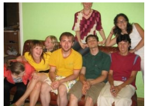
Угадай: кто из них качал прон?

Интересен тот факт, что в секте хомячок не может самостоятельно найти себе особь противоположного пола. Есть там такая штука как Подбор Пар или мэтчинг. Да, Анонимус, ты правильно понял — в секте твою вторую половинку тебе подбирает начальство. В случае фейла вялые протесты обычно лечатся дополнительной мозгомойкой и епитимьями, но обычно такое случается нечасто. Разгадки тут целых две: Живительная Вера и такой долгожданный для многих трах. Тут нужно упомянуть, что секс муниты считают грязным занятием, поэтому Мун для «начала Семьи» заповедал практиковать «трехдневную церемонию». В ходе церемонии паре предстоит три дня сношаться перед портретами Мессии и его жены.