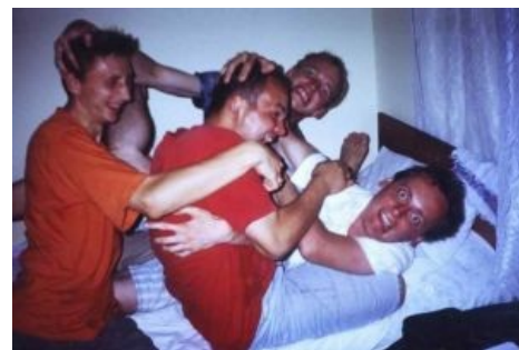
CARP такой CARP