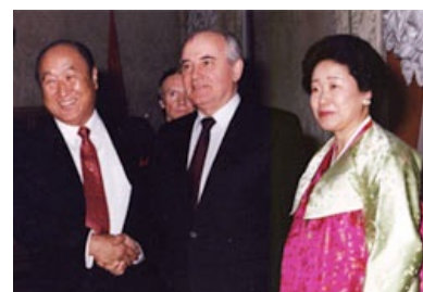
Мун разуплотняет СССР. Риальни!