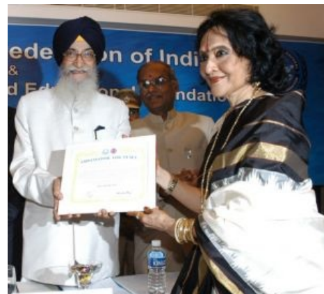
Онотоле — Посёл Мира?!?!?! ОН SHI-