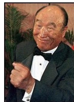
Мун смотрит как-то хитро...

«Отношения между ян-сон и ым-сон подобны отношениям между сон-сан и хён-сан. Следовательно, между ян-сон и ым-сон существуют взаимодополняющие отношения внутреннего и внешнего, причины и следствия, субъекта и объекта, вертикального и горизонтального. Поэтому и в Библии, например, сказано, что Бог создал женщину, Еву, как объект Адама, мужчины, из его ребра (Быт. 2:22) »