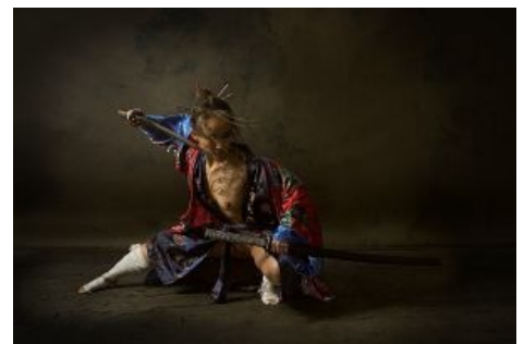
Совсем не исторично, но тема сисек раскрыта