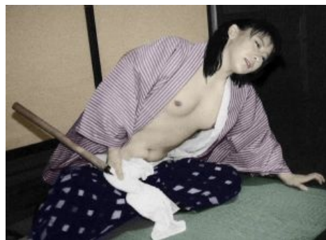
Немного «delicious flat chest» сэппуку

Жизнь — всего лишь полёт бабочки. Ну или птички.