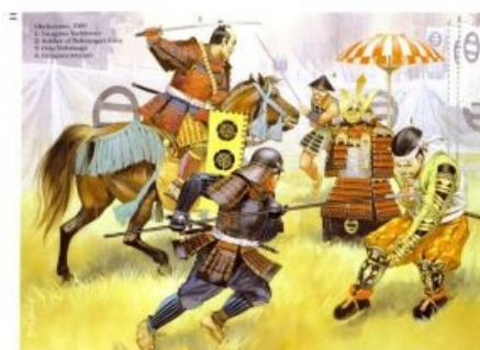
Нобунага ногебаёт Имагаву