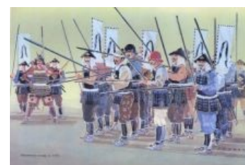
Унылые асигару унылы.

Популярность у самураев всякого рубящего оружия вроде катан и нагинат связана с тем, что японский доспех прежде всего защищает от стрел, позволяя идти в атаку без щита, а вот от прочего оружия защита не столь обязательна. И доспех в первую очередь должен был уберечь от случайной стрелы, а в рукопашной настоящий воин должен был быть настолько крут, чтобы полагаться на мастерство фехтования, а не на свой доспех. Более того, в эпоху Хэйан (включая и войну Гэмпэй), даже у VIP-ов не имелось ни наручей [7] , ни кольчужных рукавов, ни штанин! Что уж тут говорить о «простых смертных»! Хотя в последующие эпохи появились и наручи, и поножи, и даже кольчужные поддоспешники, в наиболее полном варианте представлявшие собой полный кольчужный доспех с вплетёнными пластинами, надеваемый под обычный. Большая часть воинов не паковалась в доспех по полной. Многие самураи были пешими, а не конными, и не горели желанием таскать максимальный вес. Кроме того, в Японии всегда были серьёзные проблемы с железом: было его мало, производство было крайне трудоемким, и при этом на выходе получался продукт весьма сомнительного качества . Из этого напрашивается очевидный вывод — хоть сколько-нибудь годный доспех стоил очень дорого и большинству самураев был не по карману . Не говоря уже о том, что во время гражданской войны Сэнгоку