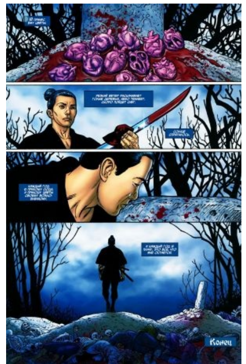
Цветы на могилу