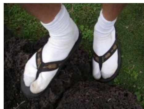
Таби + дзори. Историческая реконструкция

юбки с разрезами, состоящей из нескольких широких полос. Данная особенность связана с тем, что кони в Японии стояли невъёбенно, и если в других регионах в Средние Века тот, кто мог себе позволить хороший доспех, уж точно мог купить и коня, то в Японии всё было не так. В латной юбке рыцарского доспеха, при всей её защите, не получится присесть — её для этого надо снять. То есть этот элемент доспеха не предназначен для того, чтобы провести в нём весь день. Что касается чисто пехотных доспехов eisen-panzer , появившихся в Европе в конце XV — начале XVI веков, то в народе они имели прозвище scheissen-panzer , и все уважающие себя кузнецы оптимизировали доспех для конных нужд: кто платит, тот и заказывает музыку!