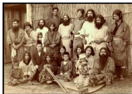
Сами мы местные...

В связи с общим настроением, отношение к военному делу и воинам было крайне презрительным, назначение даже на высокую военную должность считалось наказанием. Вся аристократия жила исключительно в столице, и потому худшим наказанием считалось изгнание из столицы . А в японском замкадье жизнь была суровой: порою поднимались крестьянские восстания, а кое-где шли войны с настоящими варварами — . С суровыми косматыми мужиками, исконными обитателями Японских островов и лежащих к северу от них земель. Доставляет, что с точки зрения европейцев айну обладают внешностью белого человека . Из-за этого японцы, привыкшие, что человек такой внешности — дикий варвар и уж никак не может технологически превосходить цивилизованных японцев/китайцев/корейцев, впервые столкнувшись с европейцами, испытали нешуточный разрыв шаблона . Кстати говоря, самурайская культура и техника ведения боя во многом восходят к айнским боевым приёмам, а отдельные самурайские кланы по происхождению — айнские, наиболее известный из таких — клан Абэ .