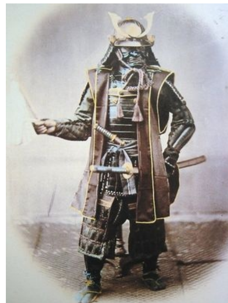
Средневековый Дарт Вейдер

Для японских доспехов также характерно частое наличие латной