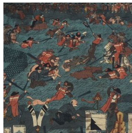
Сёгун Ёритомо очень любил поохотиться