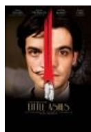
Обложка фильма о сабже.