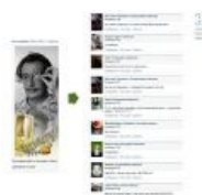
Дали — благодатная нямка. Лемминги негодуэ.