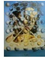
Портрет Пабло Пикассо.