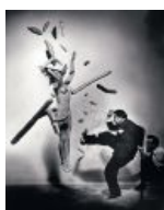
Да, это фотография.