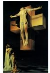
«Распятие, или Гиперкубическое тело»

Религиозный период в творчестве мэтра начался с 1949 года, когда в монастыре Боговоплощения в Авиле (Испания) он проникся идеями католического мистицизма, и продлился до конца его дней в 1989. Увлёкшись живописью эпохи Возрождения, упоролся на отличненько, чему способствовало регулярное сношение с ведущими церковногондонами того времени, в том числе Папой Пием XII . В 1954 Дали пишет «Распятие, или Гиперкубическое тело» («Corpus hypercubicus»). Выполнено оно в испанской традиции, но крест составлен из кубов (развёртка тессеракта ), и опять же на переднем плане — Гала, созерцающая распятого Г-да . В дальнейшем Святой Иоанн на Кресте, Святая Тереза Авильская, Игнатий Лойола, а вместе с ними и труднейшие теологические проблемы неизменно составляли основу забот и размышлений творца из Кадакеса.