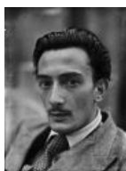
Усики еще не отросли.