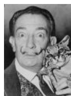
Сальвадор Дали и его сраный оцелот.