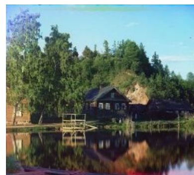
Трава была зеленее, вода была голубее.