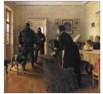
Потерянная Россия в стиле модерн

| И на обломках самовластья напишут наши имена