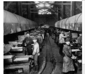
Путиловский завод — наиболее крупное и передовое предприятие Российской Империи.