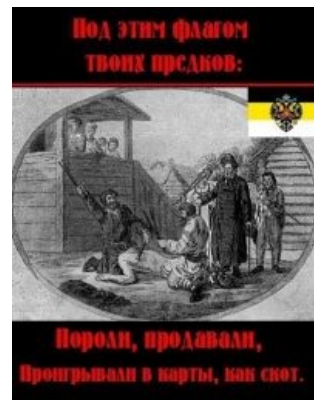
Салтычиха лютует под флагом