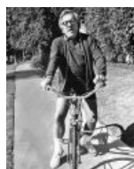
Брэдбери не любил машины