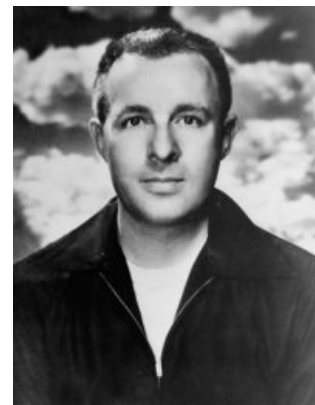
Гагарин Молодой Рэй

Так как сабж в те годы был лютым фанатом Эдгара Берроуза и особенно его «Марсианского цикла», то он, не мудрствуя лукаво, решил тоже настроичить что-нибудь про Марс , с вымершими городами и отважными колонизаторами . В результате родилась книжка «Марсианские хроники» — первый и главный вин Брэдбери. С точки зрения структуры книга представляла собой монструозное хуйпоймичто — то ли роман, то ли сборник рассказов, пестрящий взаимоисключающими параграфами и наполненный безысходностью . Людям понравилось, потекли первые нормальные денежки, и Брэдбери окончательно встал на путь писателя-фантаста. Впрочем, в интервью он продолжал утверждать, что по-прежнему пишет фэнтези, но читатели были явно с ним не согласны и постоянно подсовывали жанровые фантастические премии вроде «Хьюго» или «Небьюлы».