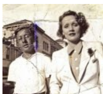
С Марлен Дитрих