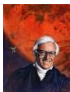
Вперёд, на Марс!