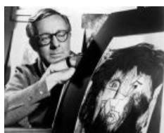
Брэдбери. Кубизм. Экзистенциальность [3]