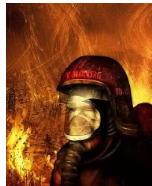
Главный герой «Фаренгейта» при исполнении

В «451°» автор открытым текстом пишет, что вина это отнюдь не злого правительства, как в большинстве антиутопий, а именно тупых 95% — им смотреть безмозглый зомбящик намного интереснее, чем зубрить матан и читать литературную классику, а Бибер милее Шнитке, а также им не хочется слышать что угодно, что оскорбляет их, даже правду про себя.