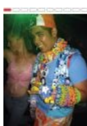
Бижутерия. Тысячи её