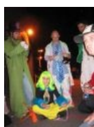
Фантазии нет предела