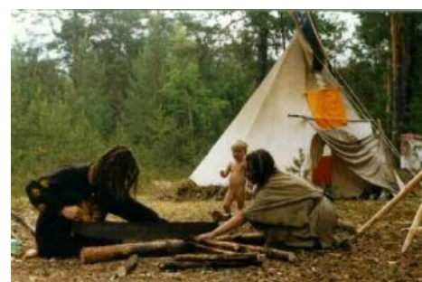
Хиппи такие хиппи