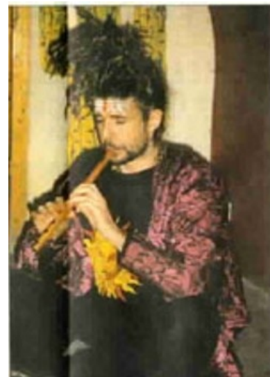
Ра-Хари не смотрит на тебя...

«Программа Катакомбной Буддийской Церкви: