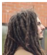
Правильные, хорошие дреды, по представлениям растаманов.