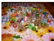
Бусы на дреды. Куча.

Растаманы верят, что, если не расчесывать волосы, то через некоторое время (порядка месяцев или лет) волосы сами спутаются в дреды. У людей с прямыми волосами дреды сваливаются за полгода-год пруф , но ждать так долго многие не хотят, либо считают, что рутс-дреды слишком неаккуратны. Во-вторых, если дреды естественны, то есть всегда будут присутствовать без участия человека, то зачем же их периодически подплетать, а также мыть как можно реже? Чтобы не расплетались? Однако факт, что дреды на несчастных европейских головушках без периодического подплетения умирают.