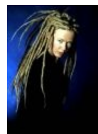
Гораздо менее идеологически правильные дреды