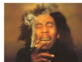
Боб, такой Марли

Роберт Неста Марли, 1945—1981. Объект фапа всех отечественных растаманов. Самый известный музыкант регги. 95% растаманов во всем мире считают его основателем растафарианства (!); да что там, даже в Африке многие считают , что растафарианство — антирасистское движение , основанное Бобом Марли. И неважно, что Боб Марли пришел в растафарианство на третьем десятке лет своей жизни, и тогда же перешел от исполнения ска и калипсо к регги.