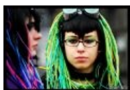
Очень, очень НЕПРАВИЛЬНЫЕ дреды