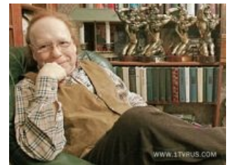
Радзинский и его сранные статуэтки

Предвкушая потерю популярности из-за того, что все выгодные герои для книг заканчивались, престарелый Радзинский во время ведения программ люто, бешено размахивал руками, яростно жестикулировал, изливал перед камерами свои неизменные актёрство и позёрство и вопил характерным тонким голосом. Но провал был неизбежен. Когда на российское ТВ понабежали многочисленные счастливыместы , камедиклабы , нашираши , большиеразницы и хорошиешутки , рейтинги таких педерачек, как его «загадки», сошли на нет, и программу плавно закрыли. Но Первый канал его все же не забыл, и в последнее время (раз в год, да к тому же и летом, когда никто телевизор не смотрит) Радзинский таки появляется на экране.