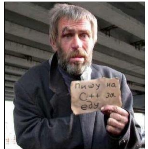
Высококультурные программисты на C++