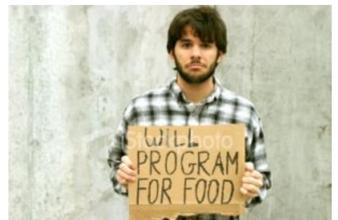
Программлю за ЖРАТ!