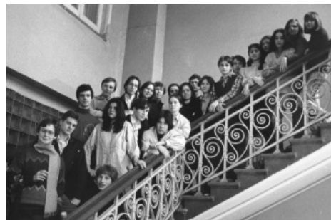
Типичный класс, какие-то дети, хотя, подождите, это же...