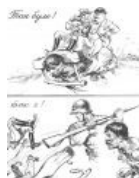
А ну-ка, давай-ка, уёбывай отсюда...