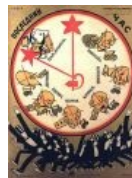
Ваше время истекает...