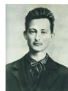
Железный Феликс (тоже поляк) ещё не обрел фирменные wąsy i broda , но уже смотрит на соплеменников должным образом. (спойлер: Да и на несоплеменников тоже.)