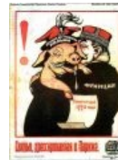
Поросёнок Юзеф (Пилсудский)