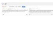
гугловерсия на польском