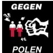
На Краутчане поляков тоже любят