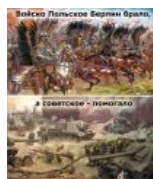
Шляхетский гонор во всей красе.