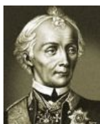
Князь Александр Васильевич Итальянский, граф Суворов-Рымникский.