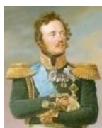
Светлейший князь Иван Фёдорович Варшавский, граф Паскевич-Эриванский.