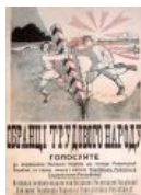
Задабривание бандерлогов — два.