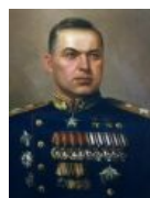
Константин Константинович Рокоссовский, расовый поляк.